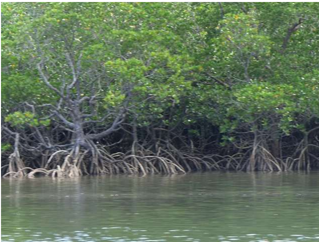
Iriomote Nagama-Gawa Mangroven