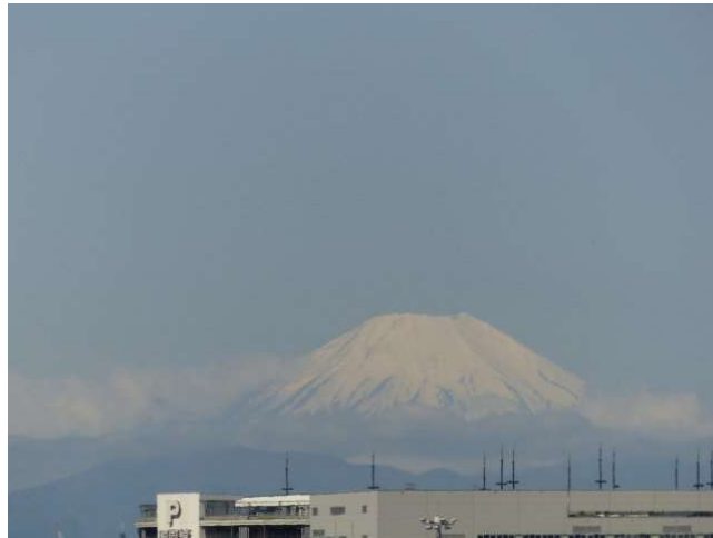
Der Fuji-San begrüßte uns schon beim Anflug in Haneda