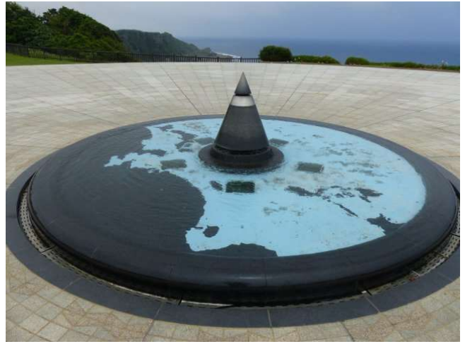
Cornerstone of Peace