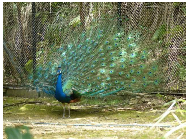
Im Neo-Park in Nago-City