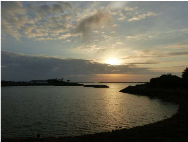
Nami no Ue Umi sora kōen