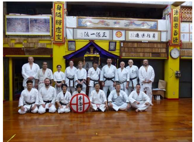
Kenshikai Dojo Nishihara