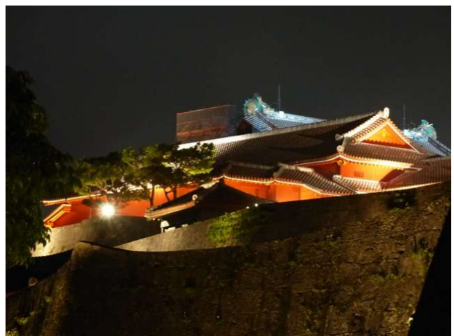
Schloss Shuri bei Nacht