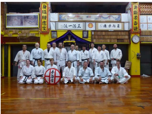
Kenshikai Dojo Nishihara

Die Insel Hamahiga, Herkunft der Kobudo Kata Hamahiga no Sai, Hamahiga no Tonfa, Hamahiga no Kama und Hamahiga no Kon