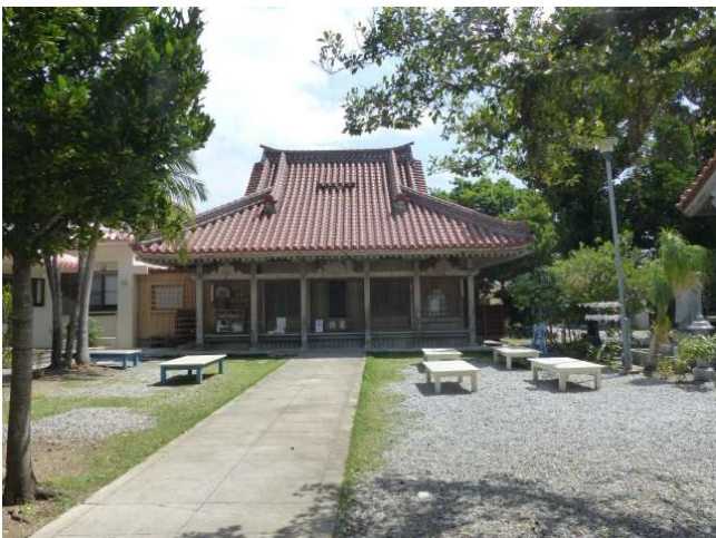
Tōrinji erbaut 1614