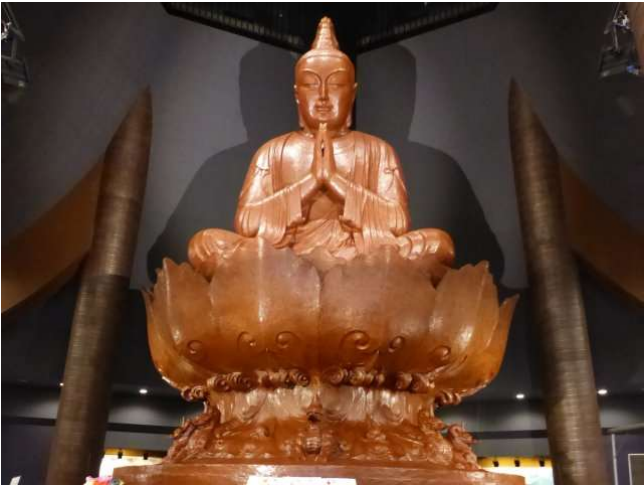
"Ruhmeshalle des Friedens" Peace Memorial Hall